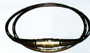
Flexible hydraulique LF3 pour l'alimentation de la cisaille MCL5 LF3 hydraulic flexible for supplying the MCL5 cutter Flexible LF3 para la alimentación de la cizalla MCL5